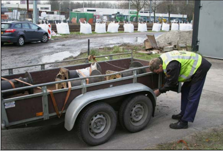
Op 13 december 2012 werden de oude buffers van de 322 opgehaald door medewerkers van de Stoomtram Hoorn - Medemblik ten behoeve van Sik 371.