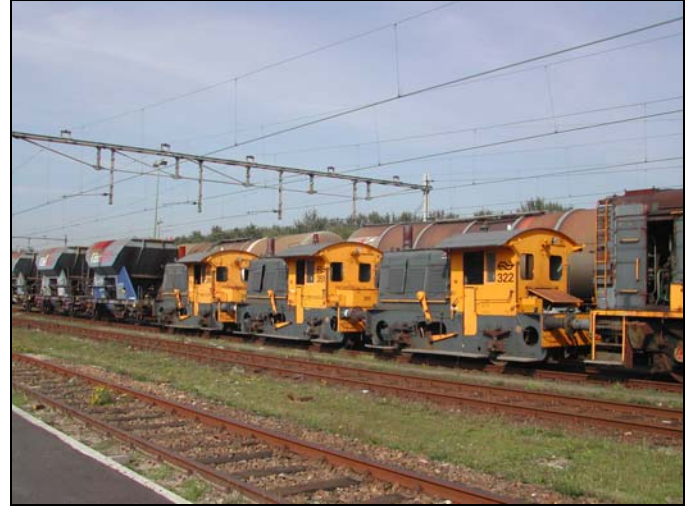
Sik 322 fungeerde als donorloc voor de klassieke buffers van de 271. Foto: Aad de Meij, 1 oktober 2003.