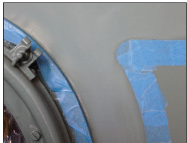
Onder: Voor het kleine rondje stond een twee euro-munt model.