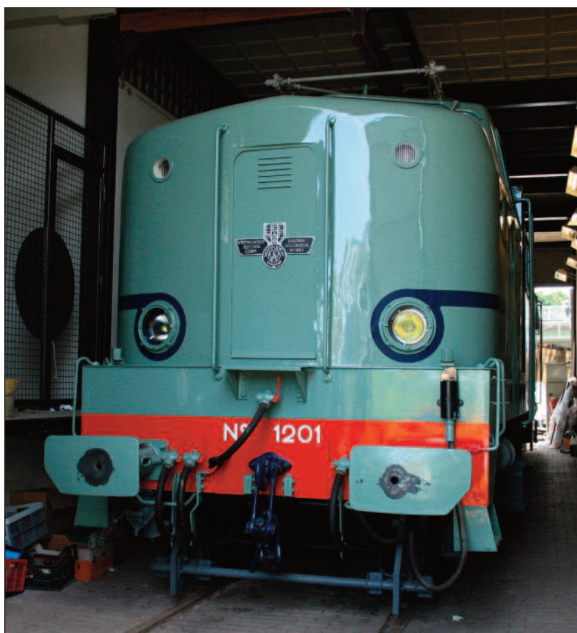
De 1201 heeft de blauwe banen terug!