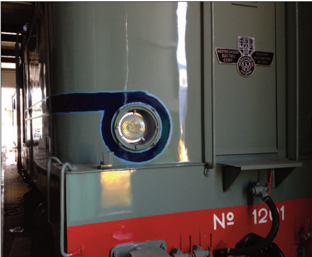
Links: Met het rollertje gaat het verven reuze snel.