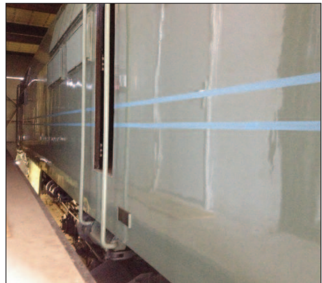
Boven: Over de hele bak is de baan van tien centimeter breedte getaped. Met achttien meter is de 1200 best een lange locomotief....

Nu deed zich bij de 1201 nog het volgende probleem voor: in het midden van de band op de zijwand bevinden zich de nummerplaten. Nadat de band ingetekend was bleken deze aan weerszijden drie centimeter te laag te zitten, of anders gezegd: de blauwe band kwam drie centimeter hoger uit. Omdat wij er zeker van zijn dat de originele frontsei-